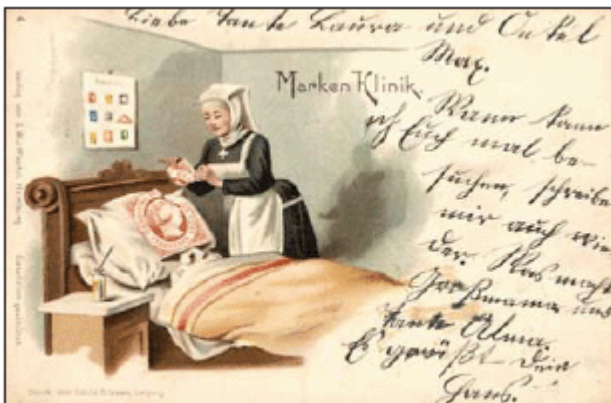
Es hat sich eigentlich nicht viel geändert, oder?

Eines aber wurde dem Autor bei Lesen dieses Werkes deutlich: